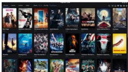
Første gang i Europa: Mand får betinget fængselsd...

Altså endnu en dom, der slår fast, at man ikke ustraffet og uden betaling kan krænke ophavsretten ved at "stjæle" adgang til det, vi andre pænt betaler for.